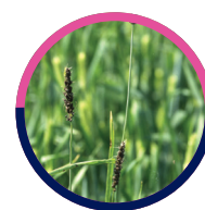
Głownia pyłąca jęczmienia